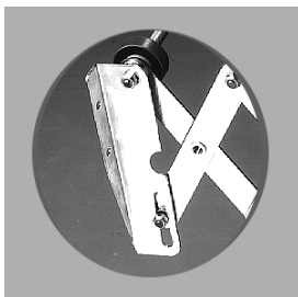
Pieza unión máquina