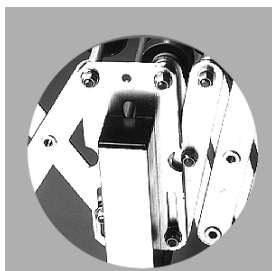
Placa soporte pata